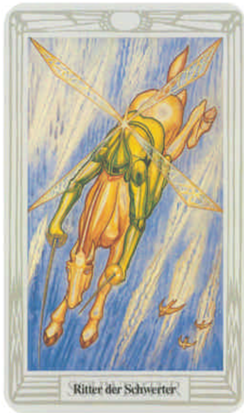
Ritter der Schwerter