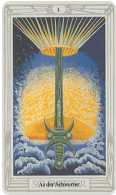
As der Schwerter