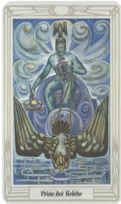
Prinz der Kelche