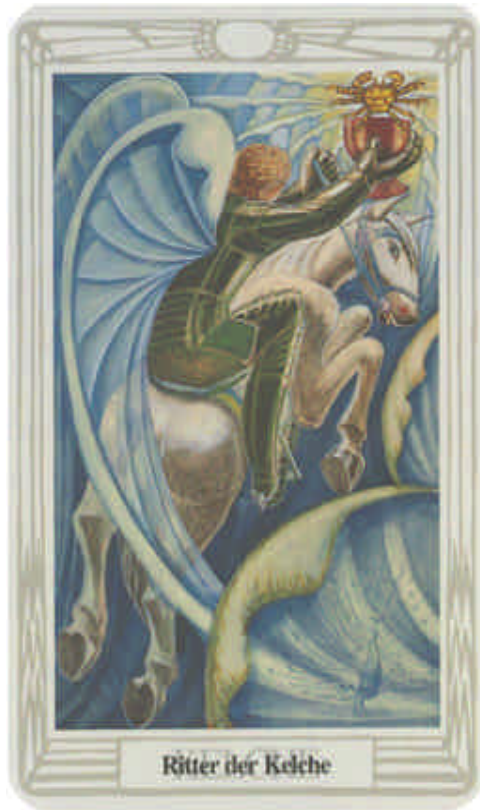
Ritter der Kelche