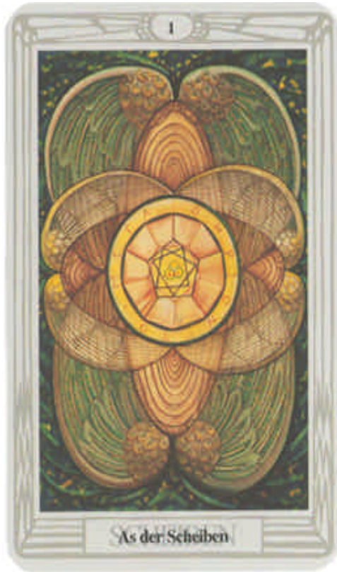
As der Scheiben