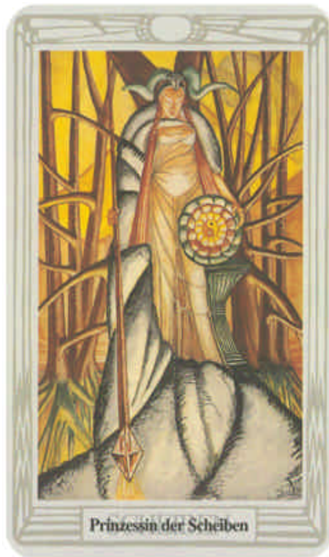
Prinzessin der Scheiben