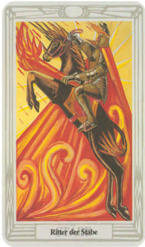
Ritter der Stäbe