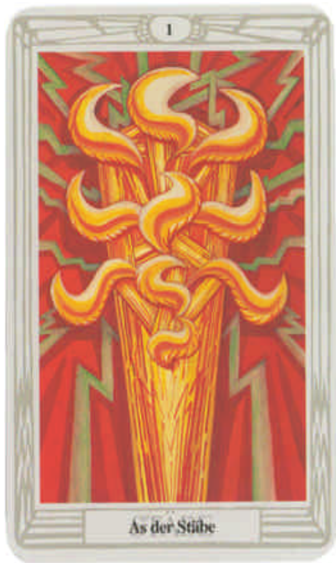
As der Stäbe