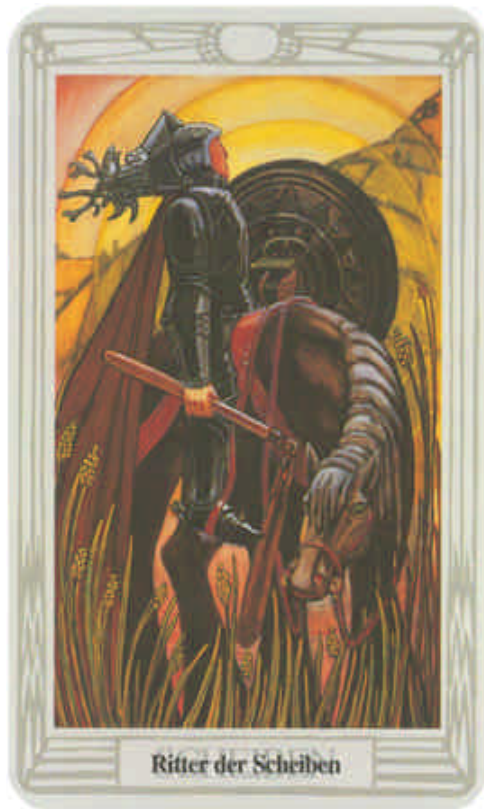
Ritter der Scheiben