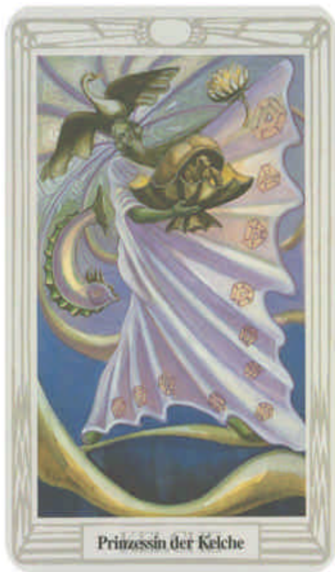
Prinzessin der Kelche