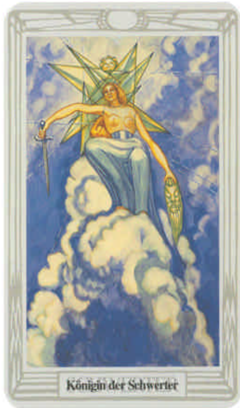
Königin der Schwerter