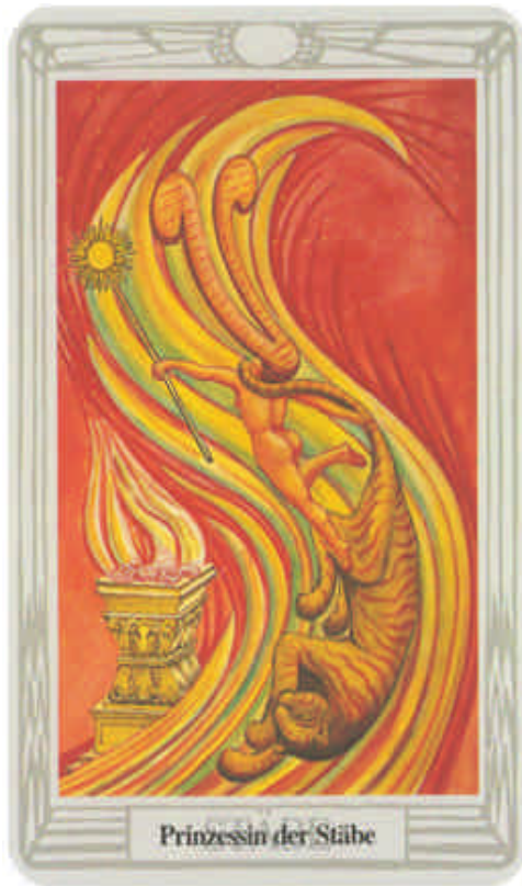
Prinzessin der Stäbe