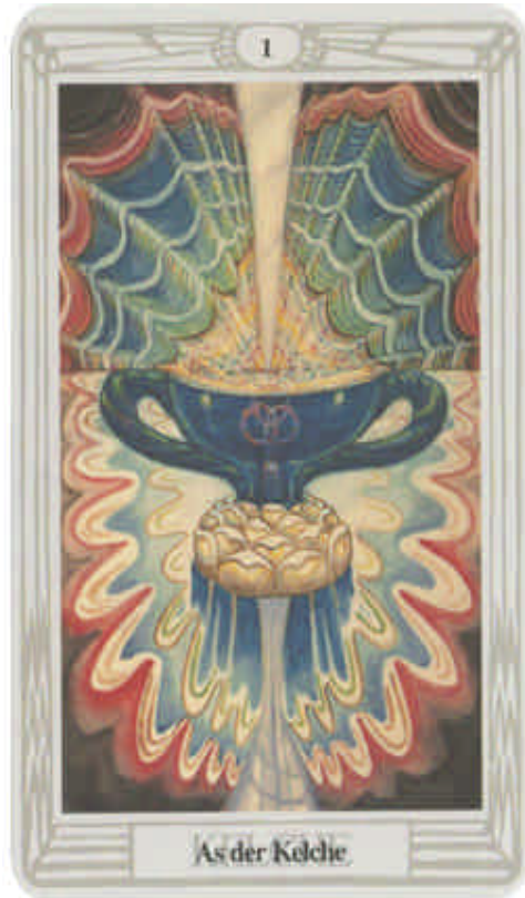
As der Kelche