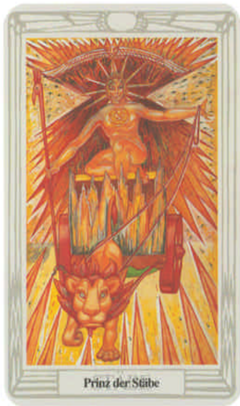
Prinz der Stäbe