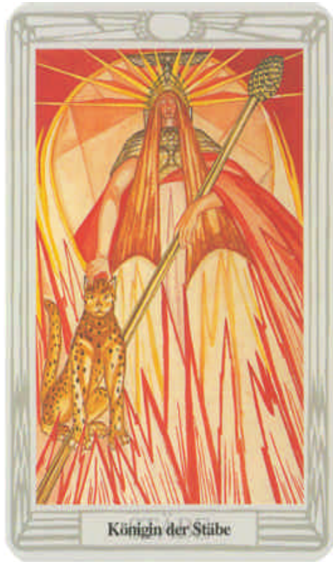
Königin der Stäbe